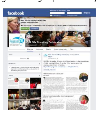
Partner z Wielkiej Brytanii dokonała również rejestracji projektu na portalu społecznościowym facebook